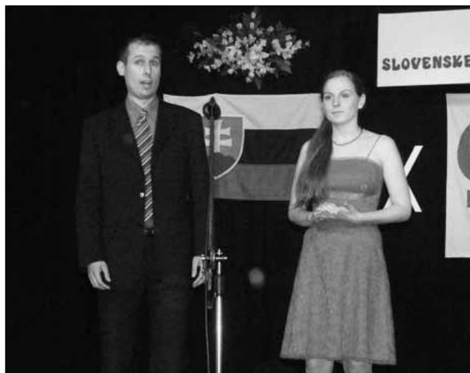
V nedeľu 16. mája 2010 pozývajú matičiari na Festival slovenskej národnej piesne.