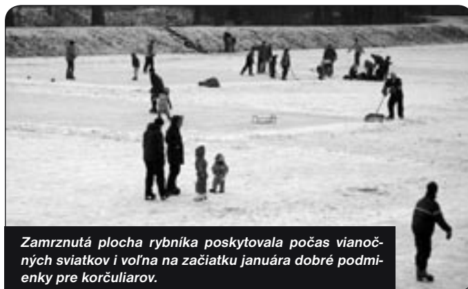
Zamrznutá plocha rybníka poskytovala počas vianočných sviatkov i voľna na začiatku januára dobré podmienky pre korčuľiarov.

V čísle: ① Vďaka ② Z radnice ③ Petícia ④ Kultúra ⑤ Spoločenská kronika * Ospravedlnenie ⑥ K odpovedi na petíciu * Problém ⑦ Inzercia ⑧ Z policajného zázpisníka * Šport