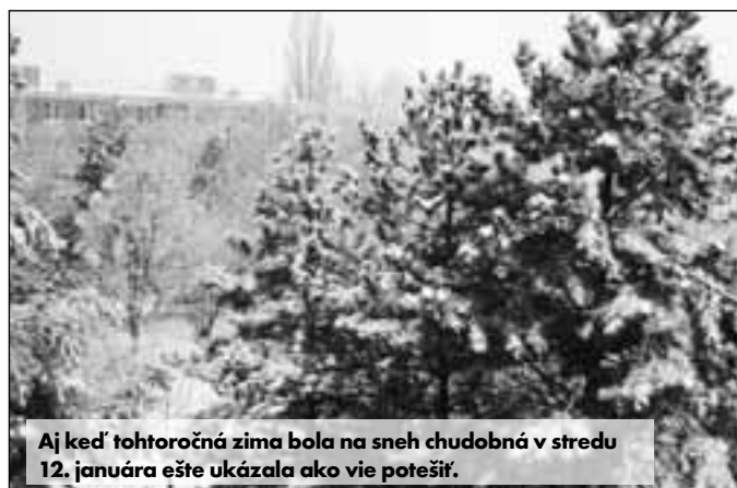
Aj keď tohtoročná zima bola na sneh chudobná v stredu 12. januára ešte ukázala ako vie potešiť.