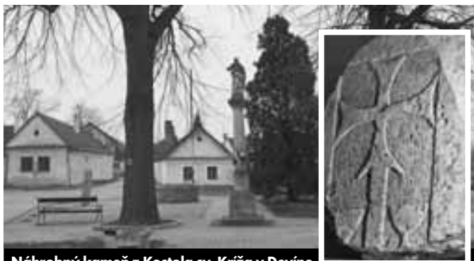
Náhrobný kameň z Kostola sv. Kríža v Devíne

Miesta budú ocenené. Tešíme sa na vás!!!!!!