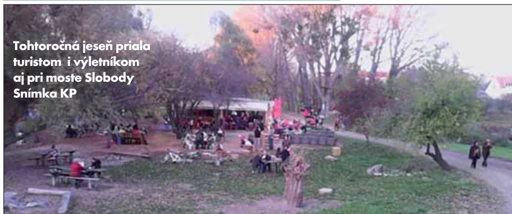
Tohtoročná jeseň priala turistom i výletníkom aj pri moste Slobody

• Vynovený cintorín. Počas tohtoročnej novembrovej spomienky na zosnulých privítal cintorín v Devínskej Novej Vsi návštevníkov zrekonštruovaným hlavným krížom a novými spevnenými chodníkmi. V dňoch 29. - 31.12.2015 bude Miestny úrad mestskej časti Bratislava-Devínska Nová Ves z dôvodu čerpania dovoleniek zatvorený.