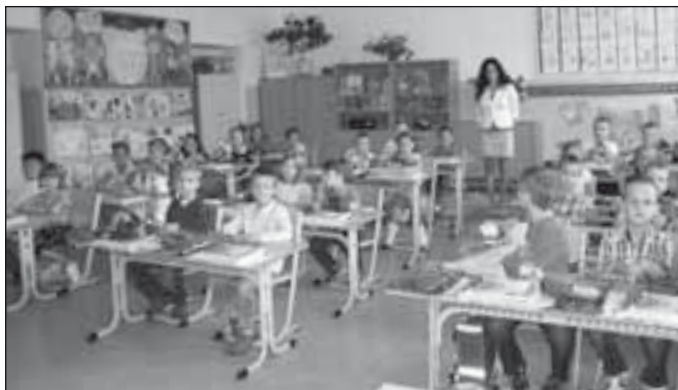
Začiatok školského roka 2012/2013 v Základnej škole Ul. I. Bukovčana

V sobotu 22. septembra 2012 o 10 00 hodine bude na nádvorí zámku Schlosshof slávnostné otvorenie mosta pre peších a cyklistov. Vstup na slávnostné otvorenie mosta je voľný. Srdečne pozývame všetkých obyvateľov MČ Bratislava – Devínskej Novej Vsi.