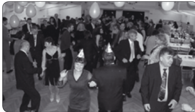
Tohtoročnú plesovú sezónu otvorili matičiari

V čísle: ① Vďaka ② Z radnice ③ Zimná údržba * VW - nové zdravotné stredisko * ZŠ I. Bukovčana 1 ④ Kultúra * 17 chorvátsky ples * Plesali Grbarčieta ⑤ Spoločenská kronika * Otvárali plesovú sezónu ⑥ Slovo Novovešťanov ⑦ Inzercia ⑧ Z policajného zápisníka * Šport * Futbalisti a motoristi pozývajú na ples