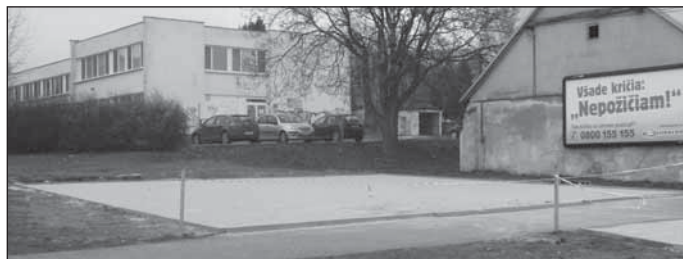
Tak na Istrijskej ulici vedľa bývalej hasičskej zbrojnice nerástla nová „bradavica“ ale parkovisko pre niekoľko áut.